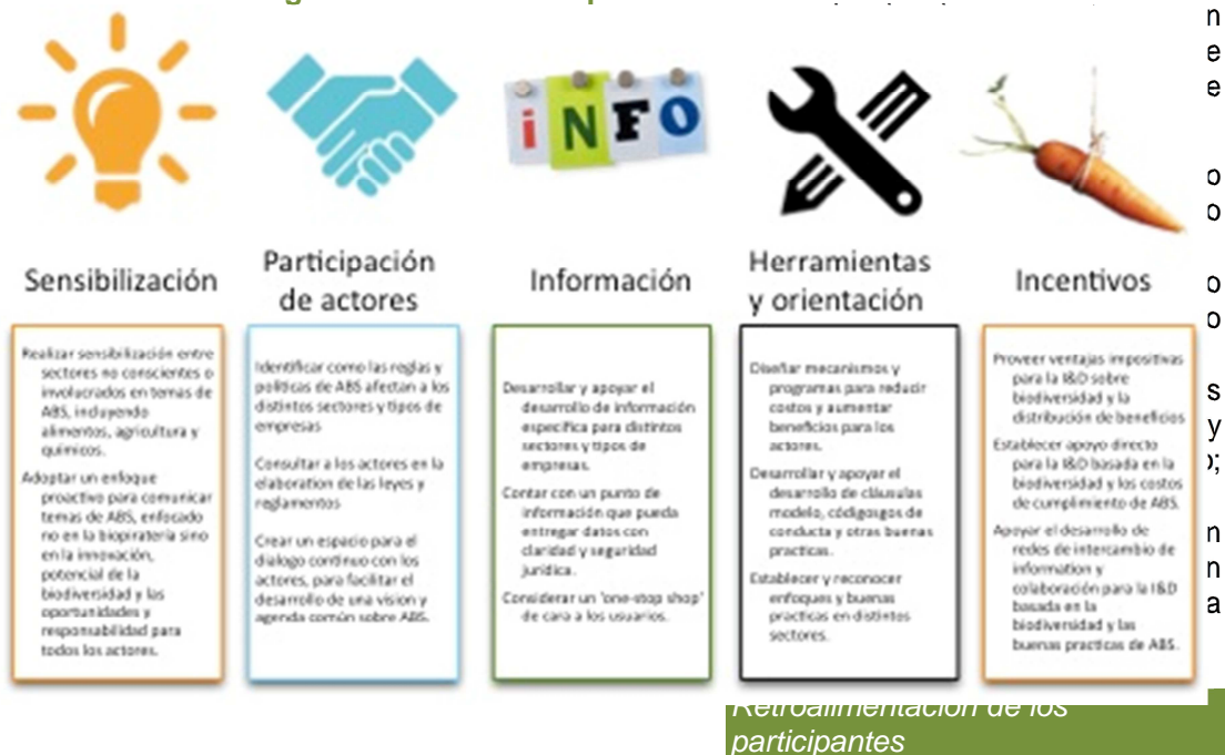
Figura 2. Medidas complementarias sobre ABS

Teniendo en cuenta los comentarios recibidos durante el taller, así como también los 24 formularios de evaluación recibidos, los participantes consideraron al taller como sumamente positivo. Los participantes apreciaron la estructura de la agenda y la información compartida, enfatizando el alto nivel de conocimiento de la experta y la utilidad de un enfoque práctico. También se mencionó el valor de los ejemplos de marcos regulatorios generados en otros países. Hubo altos niveles de aprobación de las dinámicas utilizadas – estos ejercicios permitieron a los participantes tanto expresar sus dudas como consolidar sus conocimientos.