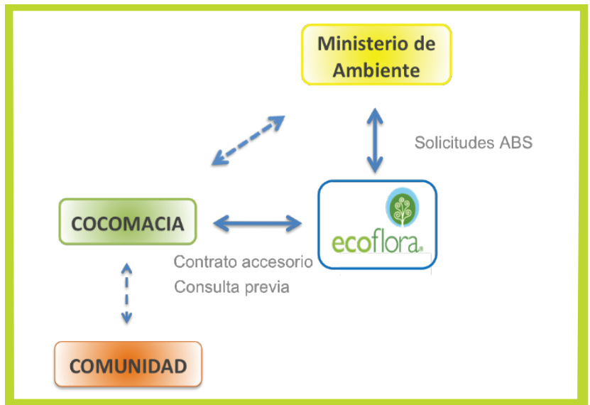
Requisitos legales ABS

Ecoflora se encuentra tramitando los permisos requeridos por la normativa colombiana en materia de acceso y distribución de beneficios (ABS por sus siglas en inglés). La empresa ha realizado las solicitudes necesarias para la investigación ligada a las condiciones óptimas de procesamiento para obtener un colorante estable y concentrado, así como las actividades tendientes a consolidar la cadena productiva. Además, Ecoflora ha desarrollado en forma conjunta con COCOMACIA, entidad considerada por esta normativa como proveedora de los recursos genéticos y productos derivados (ver Cuadro), un contrato accesorio que establece los términos de una distribución de los beneficios que asegure la factibilidad comercial, ambiental y social del proyecto. En este contexto, se está realizando una consulta previa con la participación de COCOMACIA y representantes de las comunidades, el gobierno y otros grupos de interés, se ha organizado una capacitación sobre la normativa sobre ABS, dictada por un experto independiente, y se ha apoyado la socialización de la información a nivel comunitario.