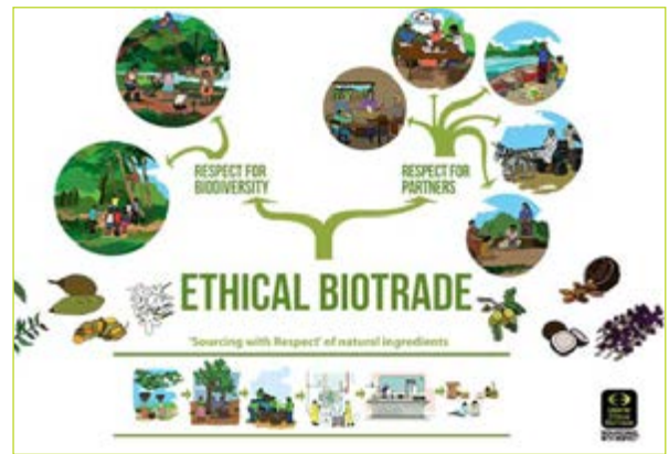
Kit para Comunidades: herramienta educativa de la UEBT para el aprendizaje de desarrollo de capacidades para las comunidades.